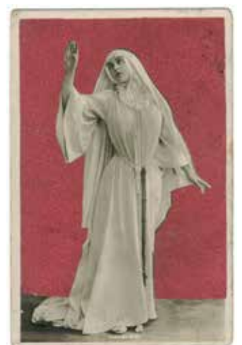
Lina Cavalieri / 1874-1944 Operndiva und Stilikone